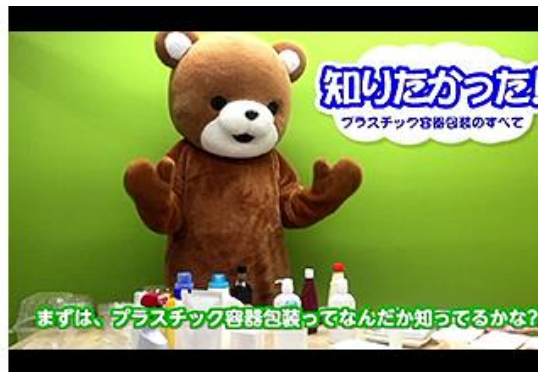
もしも容器包装が無かったら (オリジナル動画)